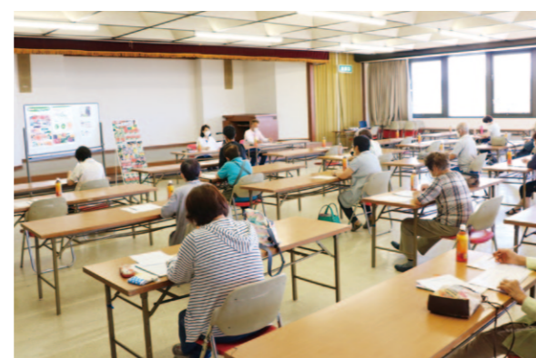
研修会に参加する直販所会員

南国営農経済センターの組合員課は8月27日、直販所会員向けに秋・冬播き野菜種子の研修会を地区本部3階で開催しました。同研修会は、出荷品目の増加による直販所の活性化を目的に今回初めて開かれました。