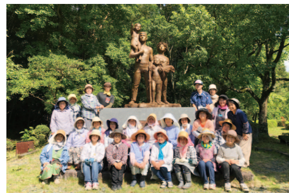
清掃活動で綺麗になった農協の森

南国市地区女性部は9月8日、高知市春野のJA教育研修センター管内の「農協の森」を清掃しました。同活動は、県内女性部組織が月ごとに持ち回りで行っています。