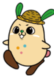
マスコットキャラクター コチット

〒781-9511 高知県高知市北御座 2-27 TEL 088-821-6091 FAX 088-856-6980 https://ja-kochi.or.jp/