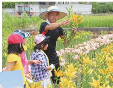
部員に教えてもらいながら、一緒に収穫