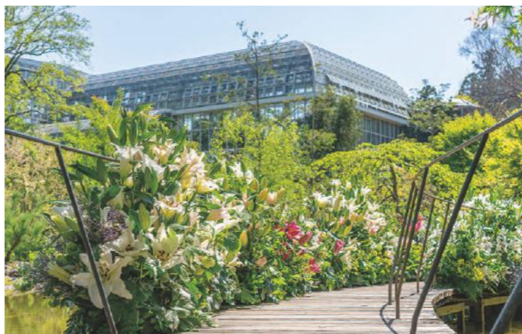
休園中の高知県立牧野植物園の池にかかる橋に飾り付けられた、県産のユリ。