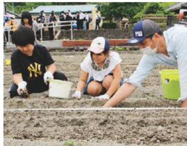
球根を植え付けて、土をしっかりとかぶせてね