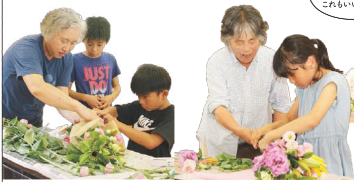
雨で収穫ができない年は、学校で花束作り。児童との触れ合いは、生産者にもいい刺激になっています。