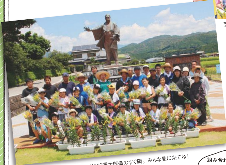
ほ場は岩崎彌太郎像のすぐ隣。みんな見に来てね!