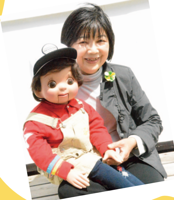
野市支所管内より