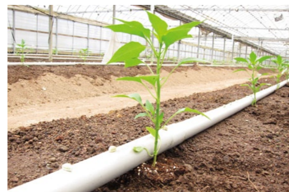
定植直後の甘とう苗

津野山管内では、まだまだ寒さの残る3月末から4月中旬ごろにかけて、夏秋栽培の土佐甘とうやシストウ、米ナス、小ナスなど果菜類の植え付け作業が行われました。写真撮影した甘とうハウスでは、前作のバンカープランツ「クレオメ」と土着天敵のタバコカスミカメの越冬に成功し、定植時からたくさんタバコカスミカメの姿を確認することができました。今年の栽培が順調に進むことを願います。