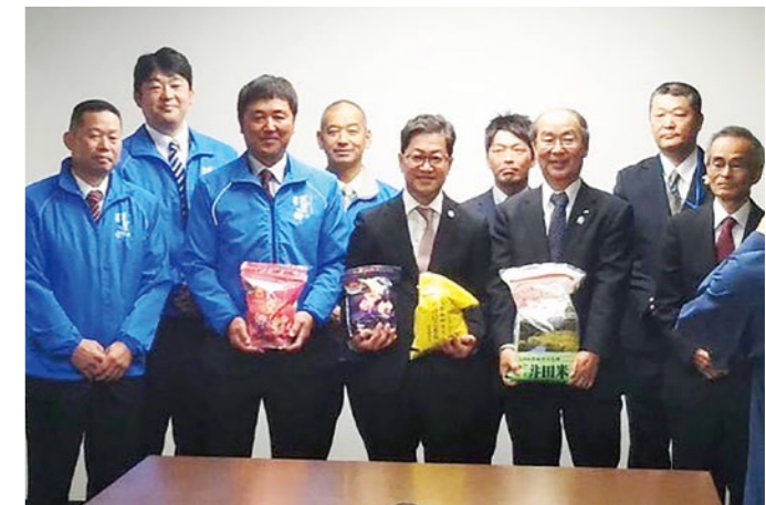
県知事に受賞の報告を行いました