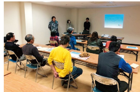
栽培時の注意点に聞き入る参加者

3月23日、夏秋ピーマン部会は新規栽培者へ向けた講習会を開き、9件の農家が参加しました。令和2年度は同部会に40名が所属しており、年々増加傾向にある露地での栽培について普及所、農協職員から説明が行われました。栽培初期の圃場作りから肥培管理、出荷の際に気を付ける点や、病害虫への対処について参加者は真剣に聞き入っていました。各部会では今後とも農家へむけた栽培指導などを行っていきます。