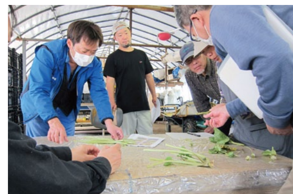
茎の品質を確かめるJA及び生産者

津野山営農経済センターは4月9日に加工用ワサビの出荷慣らし会を開催しました。管内では現在4戸の生産者が栽培しており、4月中旬から順次出荷を行ってまいります。今年は生育も順調に進み収穫量にも期待を寄せています。目慣らし会では実際にワサビの株を収穫し、出荷される茎と葉の品質を細かくチェックし生産者間での品質基準を統一しました。