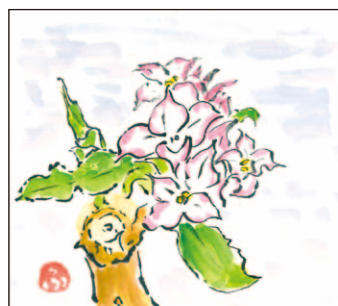
Nさん (77歳) (土佐市支所管内)