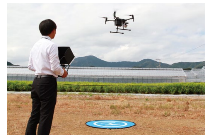
ドローンによるほ場の撮影は10月に行われました。