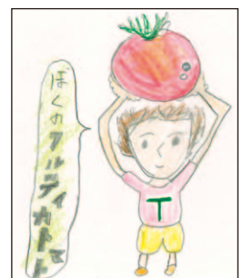
Yさん (10歳) (土佐市支所管内)