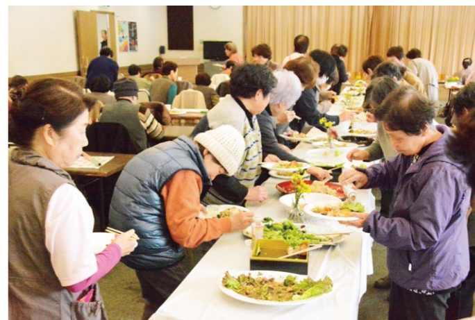
心を込めたお料理、大盛況です！