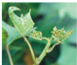
アブラムシが寄生した葉：伸長部（新葉）への寄生が多い