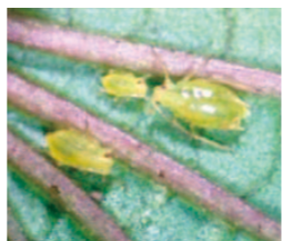
サツマイモに寄生するモモアカアブラムシの成幼虫