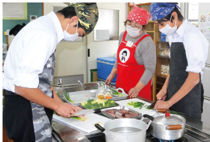
野菜の切り方から細かく教わり調理を進めます

女性部香我美支部は2月17日と19日の2日間、香南市立香我美小学校の5年生37名を対象に、香南市の加工場でみそづくりの体験学習を開きました。 これは、食の大切さを学んでもらおうと同校を対象に毎年実施している取り組み。青壮年部同支部も加わり、協力して行っています。 児童は、米麴の作り方や、米麴と大豆をあわせてミンチ機にかける作業などを体験。初めて見るみそづくりの工程や機械に興味津々で、積極的に質問をし ながら作業に没頭しました。機械から出てきたミンチ状の大豆は、女性部に習いながら、空気が入らないよう小さな桶に丁寧に詰め込んでいきます。この桶は持ち帰り、それぞれの家庭で熟成するのを待ちます。 作業後は、部員が仕込んだお手製のみそ汁も試食。思わず「おかわり！」と言う児童もいるほどで、「このおいしいみそができる工程を学ぶことができよかった。家に持って帰るみその熟成が楽しみ」と、手作りの旨味を実感しました。