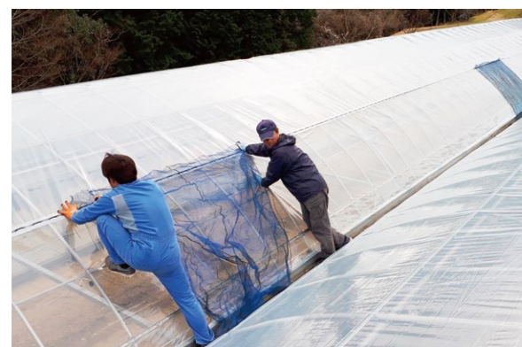
高所作業を行う部員

津野山青壮年部は活動の柱として、高齢化や作業者の不足で重労働となるハウス張りに一役買いたいと、地域農家のハウス張り作業等の受託を始動しました。本年は10件ほどのハウス張りを行っており、今後は部員の増員や技術を高め、作業による交流を深めながら産地を守っていきます。農業には不可欠な作業を通じて、新たな農業者の確保へつなげるため取り組んでいます。