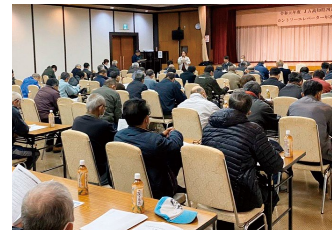
議題について承認が行われました