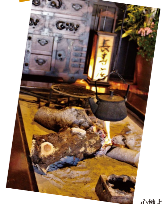
心地よい煙が漂う囲炉裏