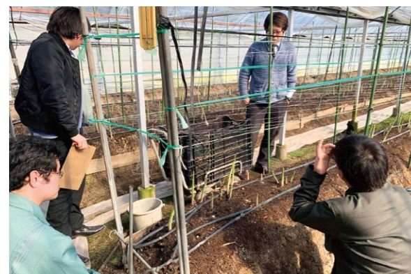
アスパラガスの圃場視察の様子

2月21日、県内の卸売業者とアスパラガスの販売方法の打ち合わせが行われました。管内の圃場を職員と業者が視察し、生育状況や出荷量を確認しました。3月初旬にかけて春芽として収穫される管内のアスパラガスは甘みや太さなどの評判がよく、従来の束での販売のほかにも、店頭でのバラ売りなども検討されるということです。今後は初夏にかけて再び出荷のピークを迎えます。おいしいアスパラガスをぜひご賞味ください！