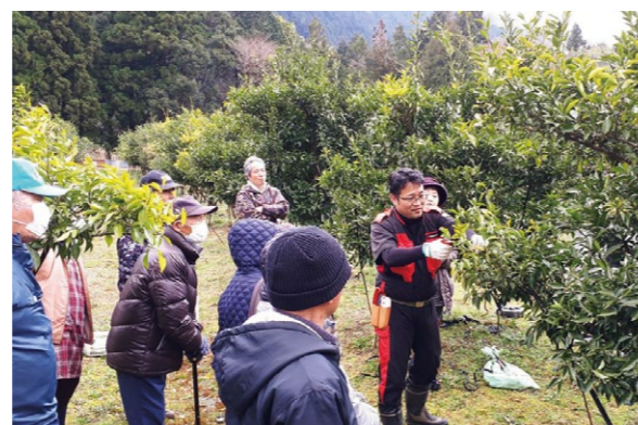
剪定を実演する指導員

津野山営農経済センターは、春の芽吹きを前にユズの選定講習会を行いました。津野町と梶原町の2部編成の講習には、両町から総勢40名の生産者が参加しました。 剪定の実演では、成り枝の判断や切り戻し位置など、樹ごとに違う前作の成り状況や枝の伸長具合を確かめたうえで、来期の着花量を増やすための選定方法が説明されました。併せて病害虫防除や追肥管理など高品質ユズの安定生産に向けた呼びかけも行いました。