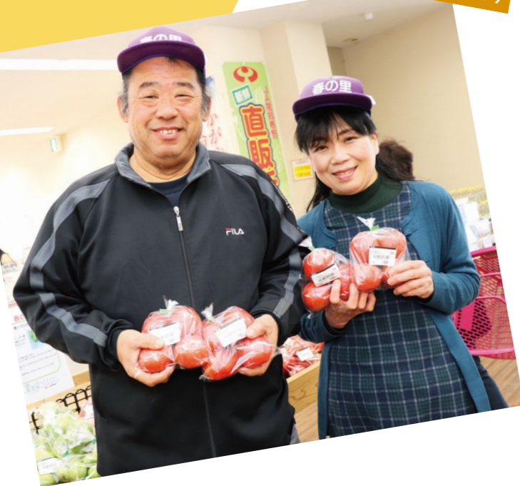
直販所「春の里」より