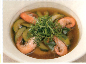
高知県「きゅうりと川エビの煮物」