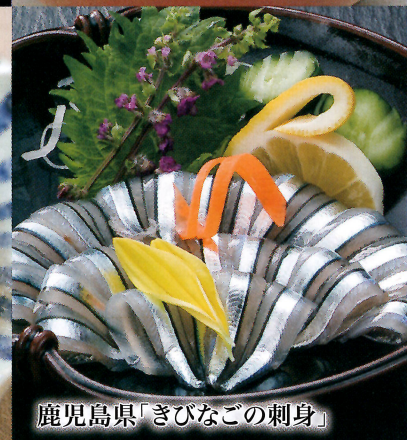
鹿児島県「きびなごの刺身」