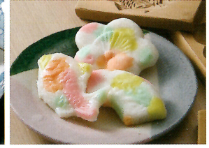
愛知県「おしもん(おこしもん)」