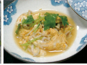
石川県「イサザの卵とじ」