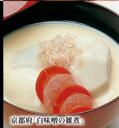
京都府「白味噌の雑煮」