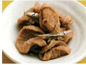
島根県「干し大根の煮しめ」