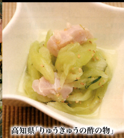
高知県「りゅうぎゅうの酢の物」