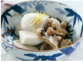
京都府「えびいもと棒だらの炊いたん」