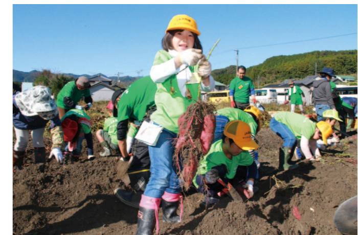
大きなサツマイモが採れました