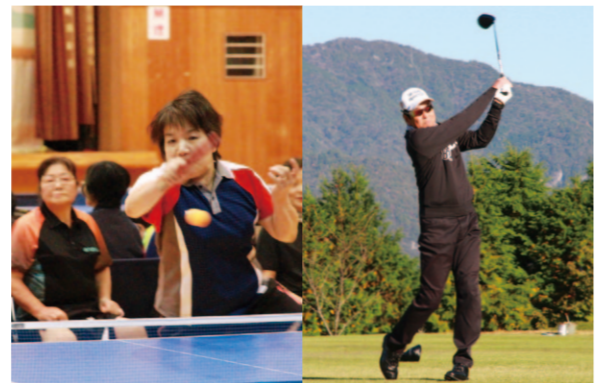
ラージボール卓球大会/ゴルフ大会

仁淀川地区年金友の会は、会員の交流のためスポーツ大会を行っています。 ラージボール卓球大会が11月7日に佐川町で、ゴルフ大会が11月15日に日高村で行われました。ラージボール卓球大会はペアで、予選リーグと決勝トーナメントを実施。62人が参加しました。ゴルフ大会は73人が参加し、大会終了後は表彰式や懇親会を行いました。 仁淀川地区年金友の会では、この他に日帰り旅行や食事会など催しを実施しています。