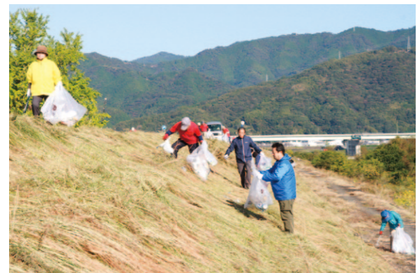
清掃活動を行う参加者ら

伊野支所は11月9日、いの町大内の仁淀川堤防沿いで「ラブリバー2019仁淀川清掃」を行いました。 JA役職員や助けあい組織「赤い禪隊」、「にこにこ会」伊野支部の会員ら37人が、地域の環境美化に励みました。例年よりも多い約217kgのゴミを回収しました。 参加者は「家から持ってきて捨てているような空き缶などがあり、こんなにひどいのかと悲しかった」「川は大切な資源。きれいに保ちたい」と話しました。