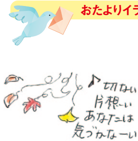
Uさん (56歳) (越知支所管内)