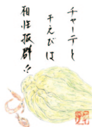
Kさん (68歳) (伊野支所管内)