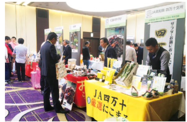
商品の熱いアピールが行われました

高西地区の販売課は11月11日、名古屋市中で行われた高知県食品試食商談会「土佐の宴」へ参加しました。2回目の開催となる今年は、昨年より多い300社のバイヤーへ向けて、四万十厳選にこまるや、四万十水耕セリ、津野山のお茶などの幅広い提案を行いました。ブースは大変盛況となり、これを機に、良い反応があったバイヤーを中心に新規販路を開拓していく予定です。