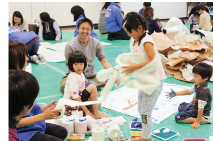
お家ではできない!? ロール紙も楽しいオモチャに変身

津野山営農経済センターは11月6日、栲原学園の小学1〜2年生を対象にサツマイモ収穫体験授業を行いました。生徒らは5月に植え付けたサツマイモのツルを除去し、畝の中の芋を傷つけないよう丁寧に収穫。今年は芋の数は少ないものの大物もよく出ていました。中にはネズミやコガネムシの被害もあり、JA指導員が来年度の対策を説明しました。収穫したサツマイモはしばらく貯蔵した後、調理実習でスイーツなどを作る予定です。