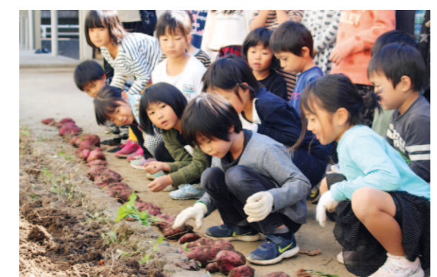
たくさん収穫できました!

津野山営農経済センターは11月6日、栲原学園の小学1〜2年生を対象にサツマイモ収穫体験授業を行いました。生徒らは5月に植え付けたサツマイモのツルを除去し、畝の中の芋を傷つけないよう丁寧に収穫。今年は芋の数は少ないものの大物もよく出ていました。中にはネズミやコガネムシの被害もあり、JA指導員が来年度の対策を説明しました。収穫したサツマイモはしばらく貯蔵した後、調理実習でスイーツなどを作る予定です。