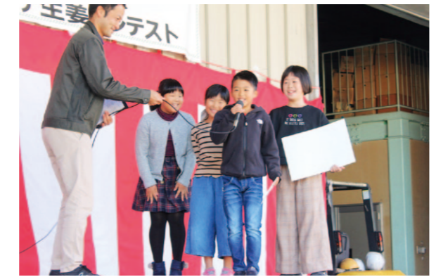
金賞を受賞した東又小学校の皆さん

台地祭りでは、ニラ、ミョウガなどの四万十町の農産物の品評会のほか、管内の小学生が参加した「第24回コンテナ生姜コンテスト」の表彰が行われました。5月に植え付けて育ててきた生姜の大きさなどを審査し、東又小学校が金賞を受賞しました。「観察ノート」では、葉の数を記録したり、スリッパを取るなど熱心に観察を続けてくれた児童も表彰されました。今後も地域の農業に親しみを持ってもらえるよう出前授業などに取り組んでいきます。