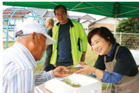
焼きそばを手渡す職員

10月20日、長岡小学校で「長岡東部地区運動会」が開催されました。運動会には長岡地区管内より11チームが参加し、全17種目に奮闘しました。長岡支所は昨年まで競技に参加していましたが、今年は焼きそばを販売。朝早くから支所に隣接する加工場で、職員が調理を行いました。味付けは、塩とソースの2種類。具材となったシントウ、ピーマン、ネギ、ニラは長岡地区産のものを使用。参加した地域住民の方々に喜んでいただけました。