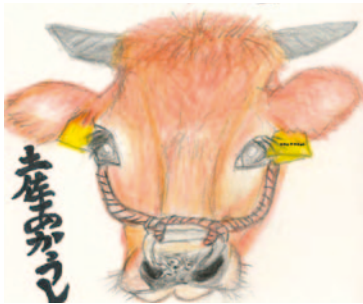
(れいほく支所・65歳)