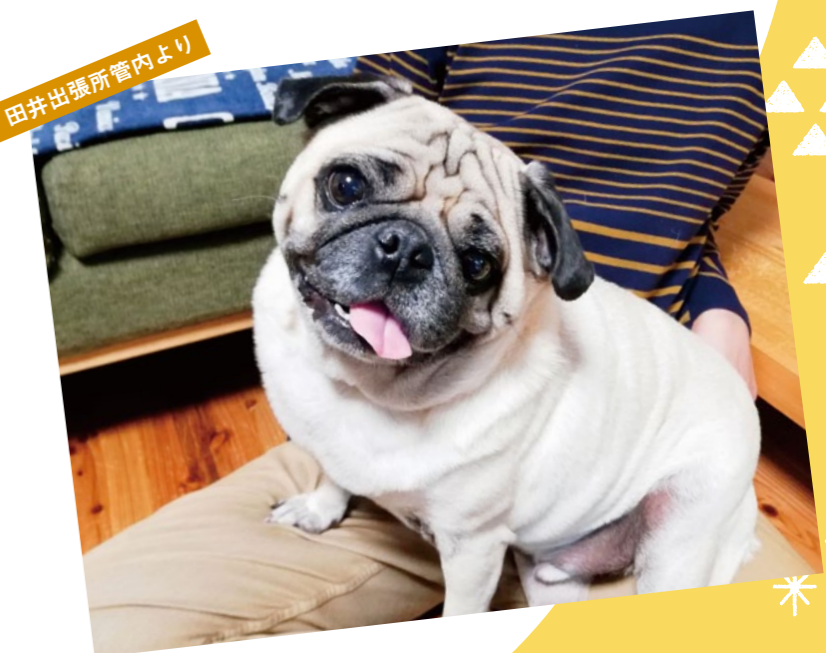
田井出張所管内より

「楽しんでいろいろなことにチャレンジしてほしい!」と、パパとママも応援しています。