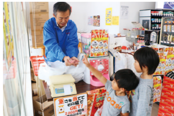
たくさんの人で賑わう創業祭

Yショップくればは10月26日、オープン5周年を記念して創業祭を開きました。店内では、商品の特売セールやガチャポン抽選会、商品詰め合わせ重量当てクイズなどを行いました。店舗周辺では、テントを設置して鮮魚特価市や女性部久礼田支部協力の元、フリーマーケットを開催。今年は女性部岡豊支部と女性部三和支部も参加。手作り品を販売するバザーも好評で、カフェコーナーやしし汁が振舞われるなどたくさんの人で賑わいました。