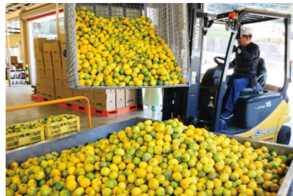
ユズの受け込み作業の様子

10月下旬、れいほく地区管内で搾汁用ユズ玉の出荷が最盛期を迎えました。れいほく柚子加工場では、昨年と同じ10月17日から11月25日までの約1カ月間受け入れを行いました。今年は裏年で、昨年に比べて出荷量が減少。生産者は「台風の影響もあり、トゲが玉に刺さって傷がついたユズが多かったかな」と、今年の出来を振り返ります。ユズは加工場で果汁と皮、種に分別され、県内外にジュースやジャムなどの加工品となって販売されます。