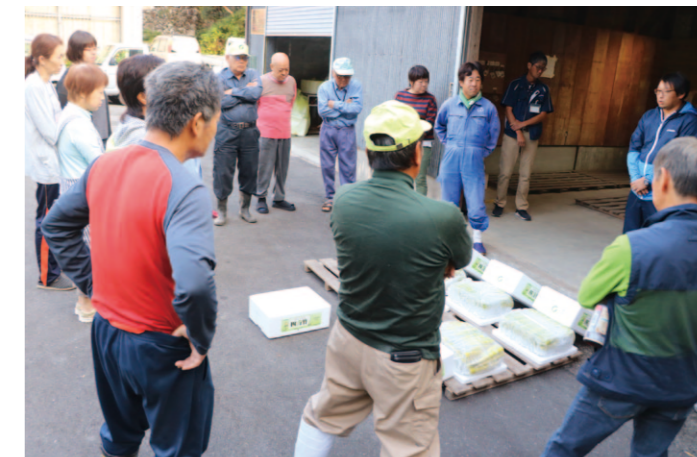
規格確認を行う生産者ら

10月20日、長岡小学校で「長岡東部地区運動会」が開催されました。運動会には長岡地区管内より11チームが参加し、全17種目に奮闘しました。長岡支所は昨年まで競技に参加していましたが、今年は焼きそばを販売。朝早くから支所に隣接する加工場で、職員が調理を行いました。味付けは、塩とソースの2種類。具材となったシントウ、ピーマン、ネギ、ニラは長岡地区産のものを使用。参加した地域住民の方々に喜んでいただけました。