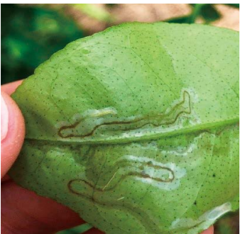
ミカンハモグリガの幼虫により食害された葉

成虫が産卵するのは、非常に若い展葉を始めて10日以内の葉齢のものが多いため発芽初期の防除が大切です。防除開始時期が遅れないように注意しましょう。園内の成虫密度を低下させるため、新芽だけではなく、樹全体に散布することも重要です。新芽の時期が不ぞろいにより長引くと被害を受ける可能性が高まります。薬剤としては、「エクスレールSE 収穫前日5000倍・3回」等が有効です。