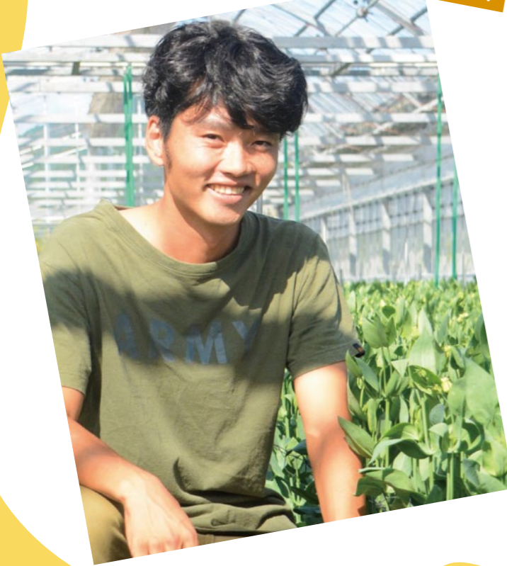
香我美支所管内より