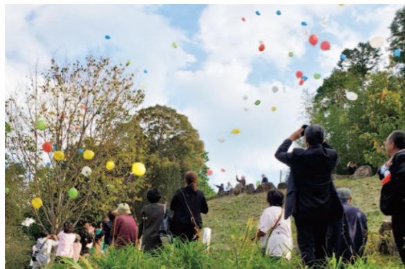
最後に花の種入り紙風船をいっせいに飛ばしました

香美市香北町にある自然公園が10周年を迎え、10月27日に記念式典が開催されました。女性部香北支部美化グループとJA香北支所は、四季折々に草花が咲く園内の景観保全を目的に、定期的に清掃活動を実施。長きに渡る取り組みが称えられ、香美市長より感謝状が授与されました。記念植樹ではフジバカマの植え付け・美化グループによるシデコブシの植樹が行われ、今後地域一体となり、町の景色を守っていくことを誓いました。