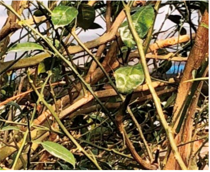
黄斑病により落葉した枝

新芽の発生と同時に防除を行います。風通しの悪い園、または樹勢の弱い樹に発生しやすいので樹体を健全に保つことが重要です。薬剤としては、「シマンダイセン水和剤（収穫90日前※日数注意 600〜800倍・4回）」または「口ブール水和剤（収穫7日前1000〜1500倍・3回）」等が有効です。