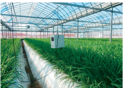
環境測定装置 (温度・湿度・炭酸ガスの測定)