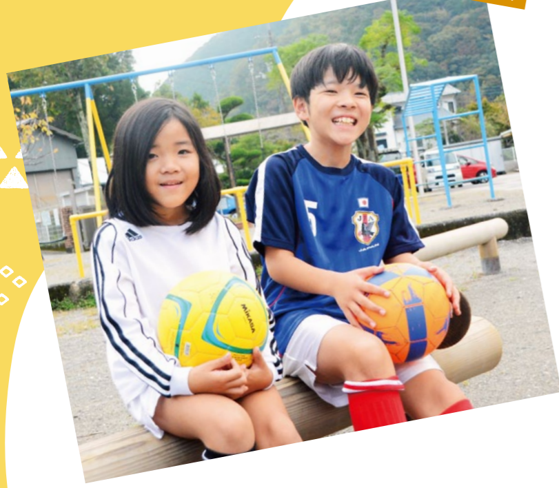
物部支所管内より