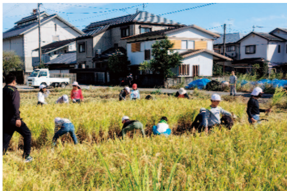
部員らに習いながら、協力して刈っていきます

青壮年部・女性部が協力し、香美地区管内の各支部で行われている学童農園事業。作物の植え付けから収穫・実食を通じて、子どもたちに農業の大切さを伝えています。土佐山田支部では10月15日、香美市立山田小学校の児童と稲刈りを実施。自分たちで植えた稲が立派に育った様子を見て、みんな大喜びの様子でした。11月7日には、収穫祭を開催。つきたてを丸めて、あんもちにし、できたての味を堪能しました。