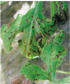
果実被害状況（写真上） 葉被害状況（写真下）