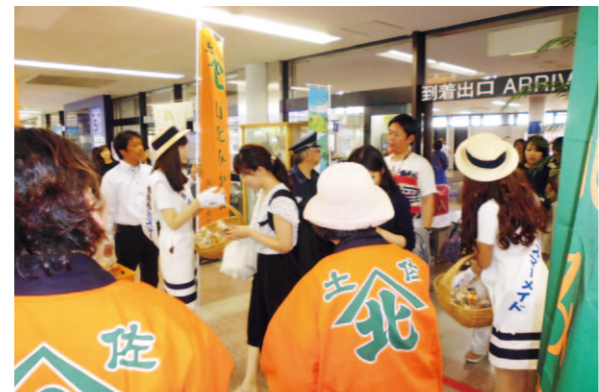
みかん色の衣装と旗でお出迎えです

香美地区果樹部は8月10日、高知龍馬空港で山北みかんの消費宣伝を行いました。 これは、お盆休みの帰省客や観光客を特産品でもてなしPRしようと、毎年行っている取り組み。果樹女性部員やJA職員、香南市のミス・マーメイドも参加しています。 到着ロビーで「おかえりなさい、どうぞ」と声をかけながら山北みかんを手渡し、にっこりお出迎え。帰省客からは突然のプレゼントに驚きながらも、笑顔で受け取りました。