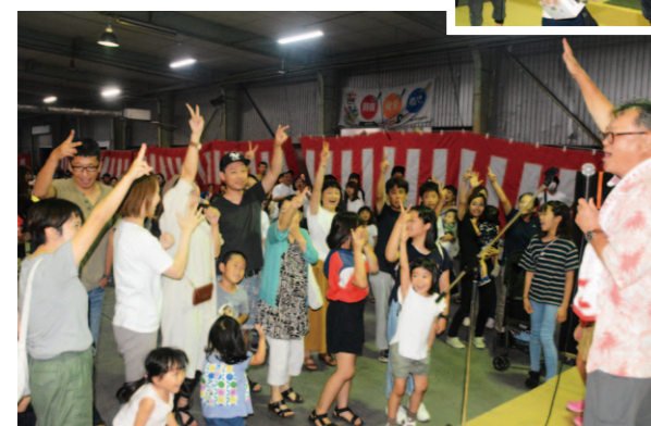
豪華賞品をかけたじゃんけん大会も大盛り上がりです！

香美地区野市支所は8月31日、野市集出荷場でふれあい感謝祭を開催。地域住民とのふれあいを目的に毎年行われており、多くの人で賑わう人気の支所祭りです。 職員や青年部野市支部、女性部同支部らがビールや焼き鳥、ニラつつよなどを販売。キッズコーナーも設け、大人から子どもまで多くの人が楽しみました。ふれあい楽団の演奏やフラダンスなどステージイベントも実施。恒例の餅なげやおたのしみ抽選会も大盛況となりました。