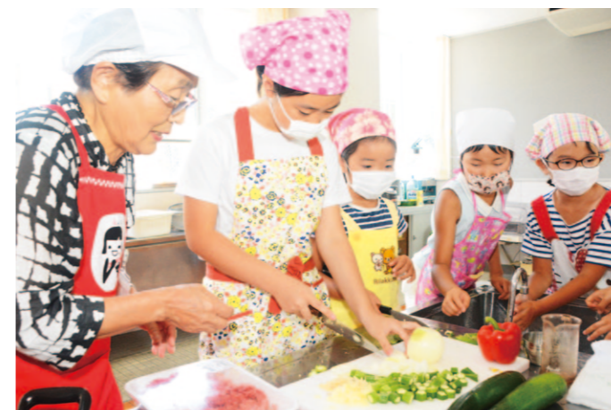
切り方を教わりながらチャレンジです！

香美地区は8月3日、香美市土佐山田町の地域交流施設「ほっと平山」で、第8期あぐりふれんど☆クラブの開校式と第1回目の活動を行いました。地域で生産している農産物や旬野菜のおいしさ、地域農業・自然環境を守ることの大切さを知ってもらおうと毎年開催しており、今年も香美・香南市内の児童14名が参加しています。 初回であるこの日は交流を深めようと、管内産品であるやっこねぎをトッピングに使い、トマトソース・ゆず味噌の2種類 のピザ作りを実施。窯で焼いた出来立てを味わい、「ねぎがシャキシャキしておいしい」などと話しながら楽しみました。その後、平山やきもの塾「風の窯」で陶芸教室を行い、茶碗やコップなどオリジナルの作品を制作。また、「ちゃぐりん」2019年8月号を用いたクイズで座学を行いました。 今年は今4回の活動を予定。作物の植え付けや収穫、山北みかんの学習などを通して、活動の中で作る友達「あぐ友」の輪をつなげていきます。