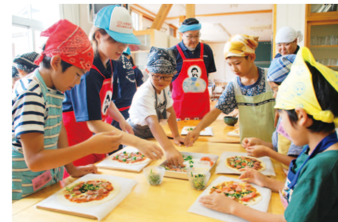
みんなでワイワイ！ピザ作りの様子です