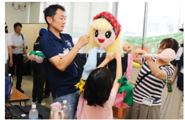
親子が手作りにしたオリジナルのかかし

昔ながらの稲作を体験するイベントが6月30日、春野営農経済センターで開かれ、76人の親子がかかし作り挑戦しました。 サニーマートと同JA直販部の共同事業として、今年で7回目の開催。5月に25組の家族が田植えを行った田圃に手作りのかかしが並びました。竹の骨組みに布や浴衣、軍手を使ってそれぞれ創意工夫。30体のかかしは7月12日から直販所「春の里」などに投票箱を置きコンテストを行いました。和服のかかしを作った親子は「昔の農家をイメージした。農業や食へることを学びたい」と話しました。