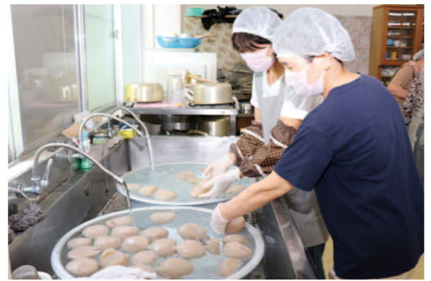
こんにゃく作りに参加した部員

ハウス園芸がひと段落する6、7月は、春野女性部の活動が盛んになります。 6月19日には、仁ノ女性部が加工所でこんにゃくを手作りしました。1時間ほど煮て柔らかくなった芋をミキサーにかけて、炭酸ナトリウムを混ぜると特有の粘り気が出ます。茶碗や手で丸く成形し、さらに1時間半ほど煮ると弾力のあるこんにゃくの出来上がり。こんにゃくは、希望者に販売したり、地域の人にふるまいました。 JA女性部では、こんにゃくの他にも味噌、焼肉のたれなどを手作りする活動をしています。