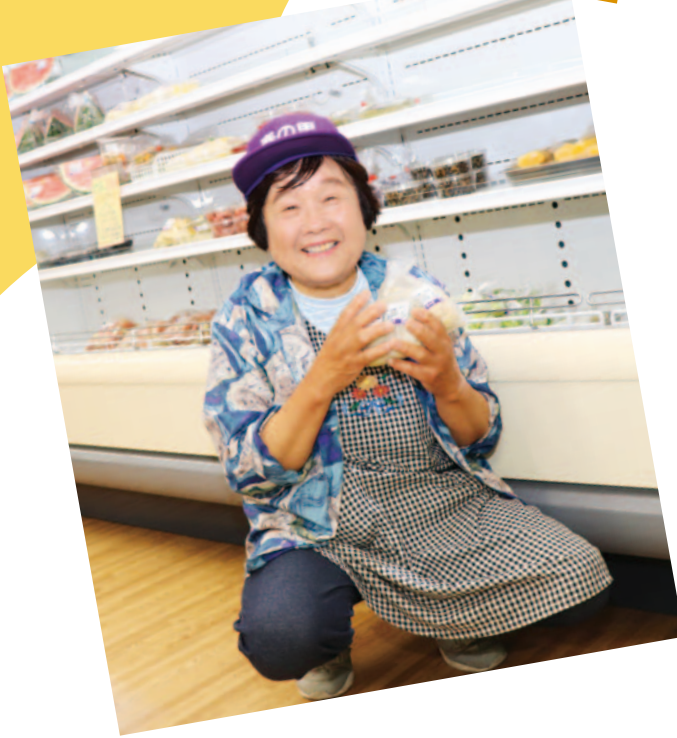
直売所「春の里」より