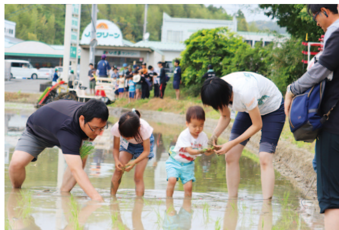
お米を食べる時、思い出してね。