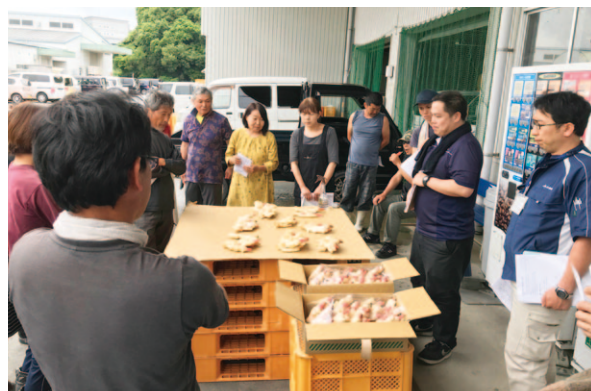
品質を統一するための目慣らし会

ショウガ部会では5月31日、生産者20名が参加して出荷前の目慣らし会を行いました。 暖冬の影響で栽培管理が困難であったものの、大きさも良好で収穫量は前年並み。出荷のピークを迎える6、7月は梅雨から高温の時期となるため傷みに注意することや、選別による等級付けの基準を全員で確認しました。