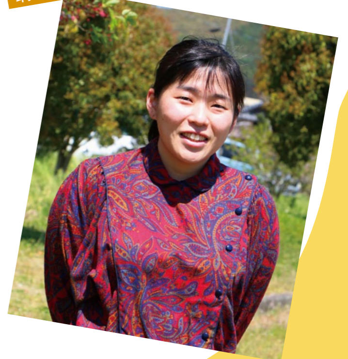
斗賀野支所管内より

ダンスの良さは? と聞くと「自分を成長させてくれる」とのこと。日々の積み重ねの大切さは現在の勉強にも生かされているようです。「患者さんを笑顔にできる看護師になりたい」と話していました。