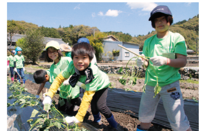
サツマイモのつる植えを行う子どもたち