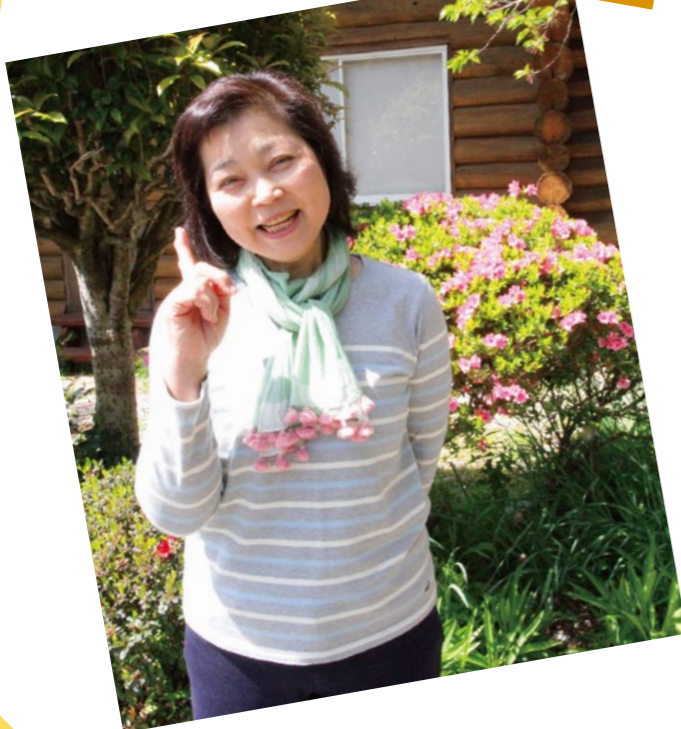
佐川支所管内より