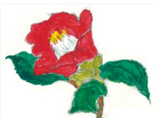
Nさん (日高支所管内)