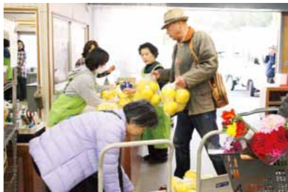
土佐文旦を買い求める来場客

土佐市北原地区の直販所「北原ふるさと市」は3月2日、「土佐文旦まつり」を開きました。兵庫県から駆け付けた夫妻は「車で買いに来た。もう10年近く通っている。友だちや親戚も土佐文旦を楽しみにしている」と喜びました。