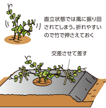
直立状態では風に振り回されてしまう。折れやすいので竹で押さえておく