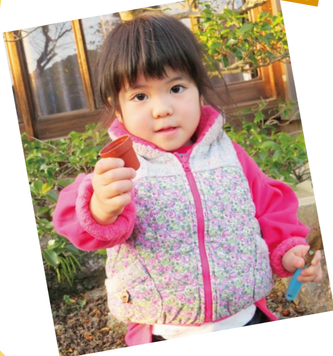
伊野支所管内より