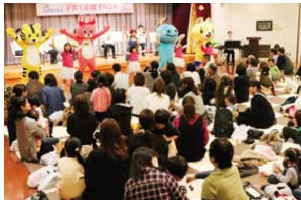
大人も子供も楽しめました♪

3月9日、子育て支援を目的とした「こどもくらぶ」のイベント「0歳からの音楽コンサート」を佐川支所で開きました。会員親子ら74世帯、244人が参加し、子どもたちは生演奏による歌とダンスの他、絵本の読み聞かせや曲当てクイズなどを楽しみました。