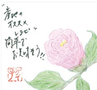
Kさん (伊野支所管内)