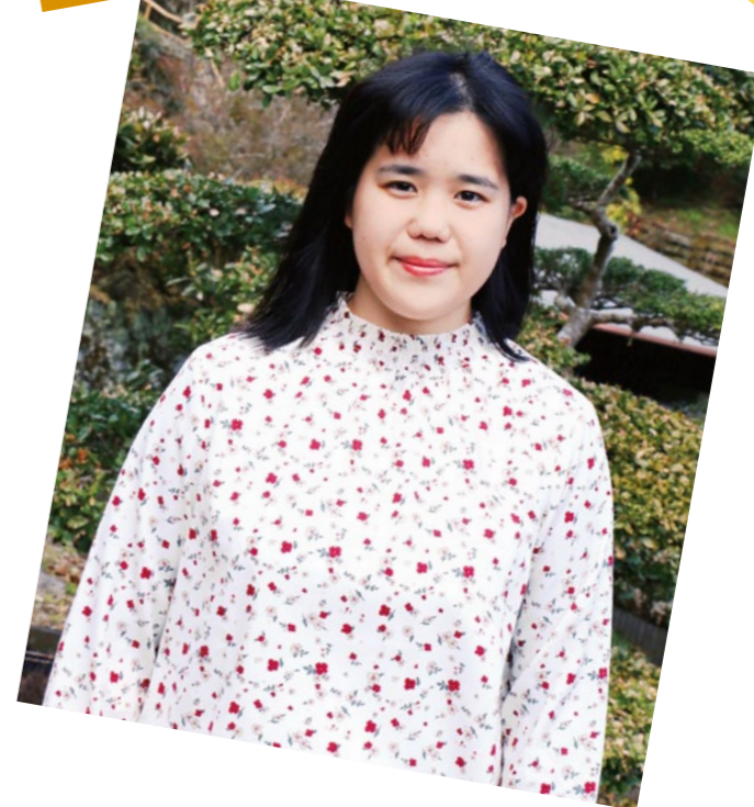
池川支所管内より

「分からないこともたくさんあると思うけど、色々なことを吸収したい。子どもたちに寄り添える先生になりたい」と話す“あみせんせい”の挑戦は始まったばかりです。