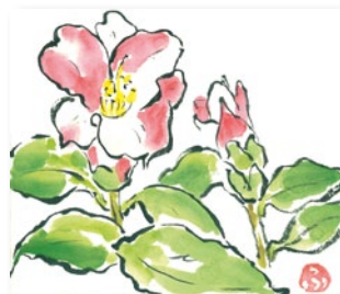
Nさん (土佐市支所管内)