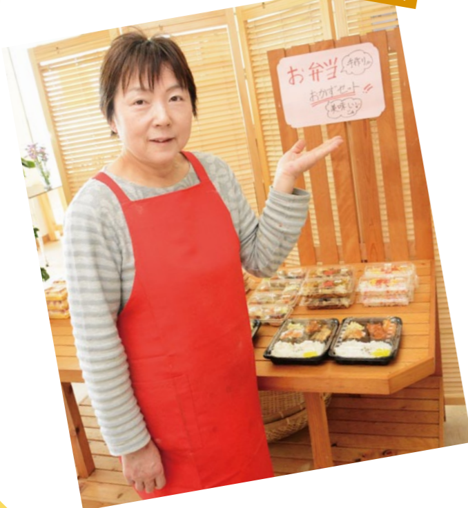
野市支所管内より