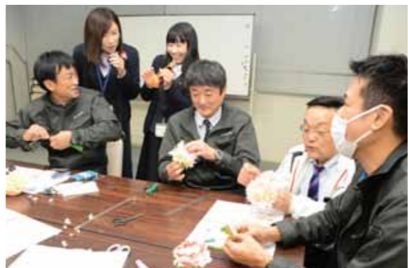
常勤役員らも参加し、仕上がりを見せ合うなどして交流しました

香美地区生活事業担当部署は3月7日、役員を対象に『家の光』記事活用研修会を開催。この活動は、まずは職員が知る、ことを目的として昨年度より始めた取り組みで、生活活動への理解促進や交流などがねらい。 約25人が終業後に集まり、『家の光』平成31年3月号掲載の「ペーパーフラー加湿器」のハンドメイドを実施。平成30年11月号掲載の「おさつら焼き」も用意し、エコープマーク品のおいしさや便利さについてPRも行いました。