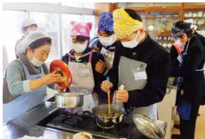
部員に教わりながら、みそ汁作り！