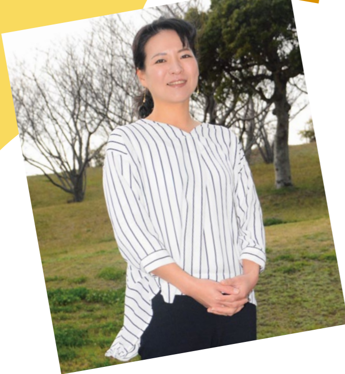
吉川支所管内より