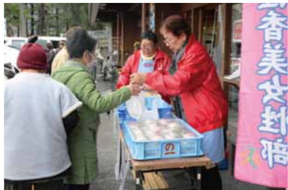
「今年も楽しみにしちゃった」と、毎年訪れる方もいます

女性部夜須支部は3月3日、夜須町のヤ・シイパーク内の直販所「やすらぎ市」前で、ひな祭りにいろどりを添えてもらうと3色もち販売を行いました。 この取り組みは毎年恒例となっており、本年度10回目。つぎたてのもちを心を込めて丸め、約700パックを販売しました。呼び込みを聞いて足を止めた買い物客や、娘や孫の節句にと訪れる人でブース前は大賑わい。販売した部員は「雨の予報だったので心配もあったが、無事に販売できてよかった」と話しました。