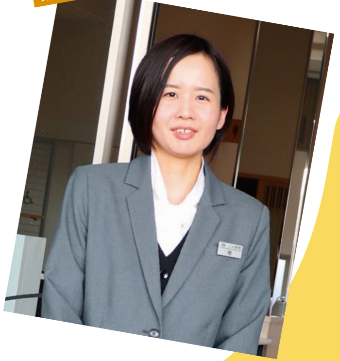
葬祭会館ルミエールはるのより

JAメモリアルこうちに入社して半年になります。以前はアパレル関係の仕事をしていましたが、祖父の葬儀の時、会館の職員の方にすぐ助けられたことをきっかけに、この仕事に就きました。まだまだ勉強中ですが、上着をお預かりしたり、お困りの方に声掛けをするなど、人の気持ちに寄り添う対応を心がけています。