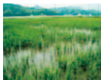
食害にあったほ場