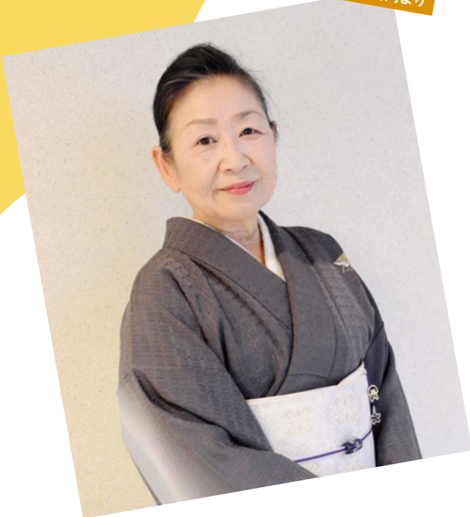
夜須支所管内より