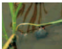
スクミリンゴガイ

別名ジャンボタニシと呼ばれるおり、田植後2〜3週間の稚苗を食害します。水温が14℃以上になると活動を始め、田植後に食害されると分げつが抑制されたり、酷い場合は欠株になり収量が低下するので適時防除を行います。