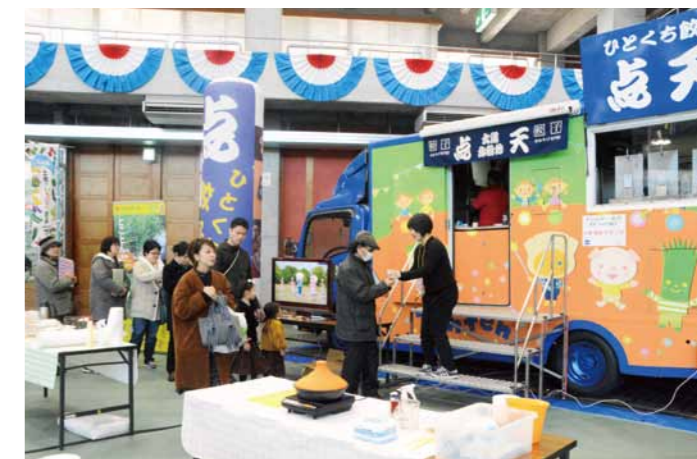
点天carの様子。行列はまだまだまだ続きます