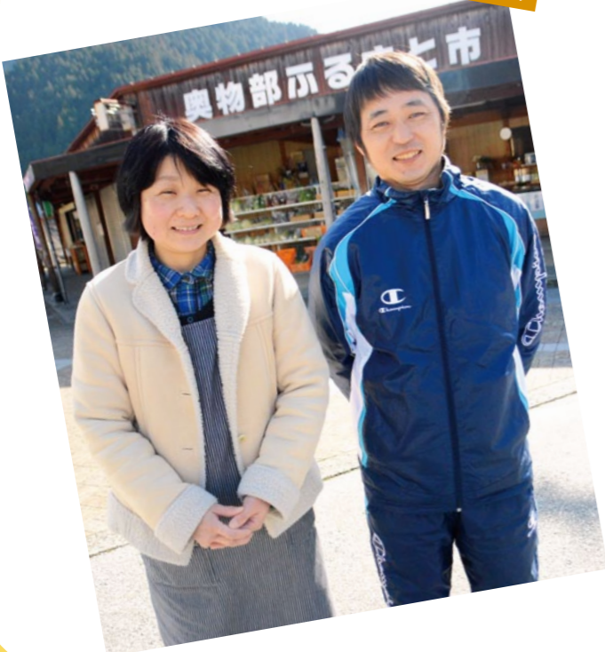
物部支所管内より