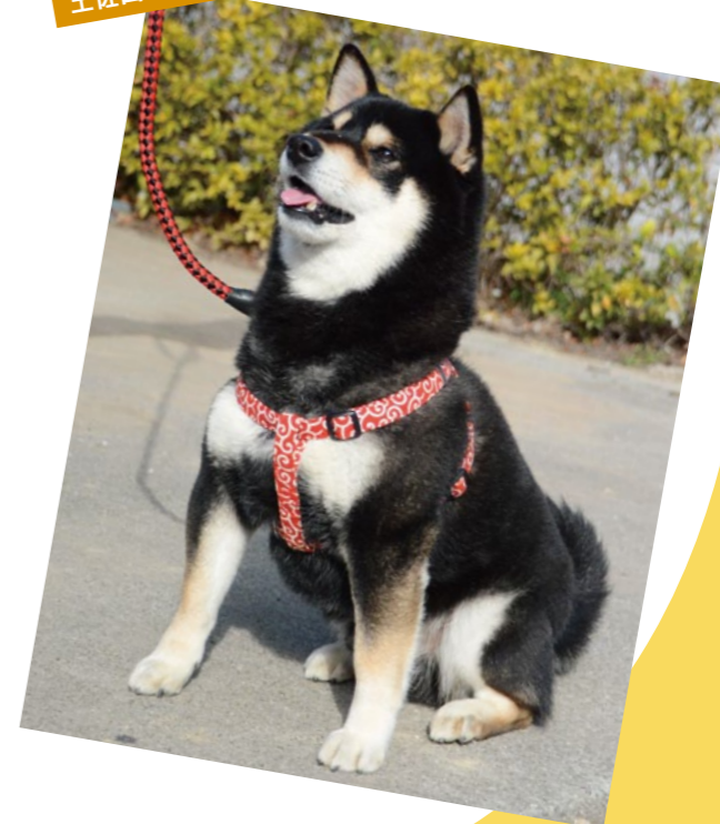
土佐山田支所管内より

甘えん坊で、「ボールを投げるより、食べ物を持ってキャッチさせるほうが上手！」くらい食いしん坊だという柴犬の大福くん。この視線…、実は、飼い主さんが手に持っているおやつをジューッと見つめているんです！(笑)遊んでもらったり、おやつをもらったりとご近所さんにも大人気の大福くんでした☆