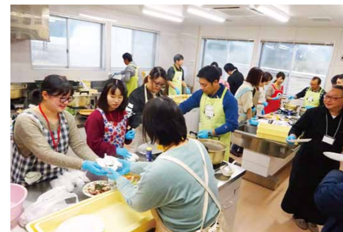
収穫したトマトで調理をしながら交流です

高知ぎっかけMAKEプロジェクト実行委員会主催で2月3日、独身男女の出会いの場を提供しようと、香南市で「第1回食からはじまる、'en」が開催されました。 このプロジェクトは、高知市内の飲食店(株)WOOや香美市、青壮年部土佐香美本部がアイデアアップ。今までのノウハウを持ち寄り、食と農を通じた産・官・民連携による多様なきっかけや、出会いを生み出そうと創設されました。 その第一弾企画として、農と食への理解を深めてもらおうと独身男女の出会いの場を提供。男性11名、女性12名が参加し、当部盟友のほ場でフルーツトマトの収穫体験を実施しました。 その後はフルーツトマトをたっぷり使ったパスタやサラダなどを作りながら交流。結果、2組のカップルが成立しました。イベント関係者は「今後も少しでも当産地の農産物に触れて頂き興味を持ってもらうことにも、新たな出会いのきっかけとして素敵な時間を過ごしてもらえれば」と話しました。