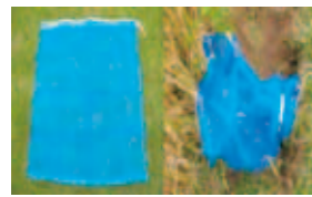
取水口に網を張り対策