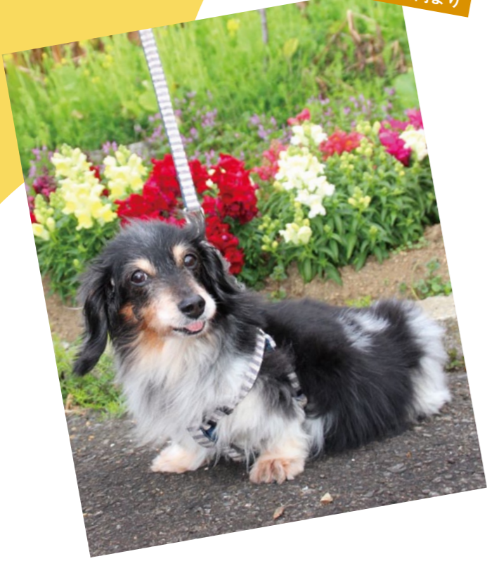
吉良川支所管内より