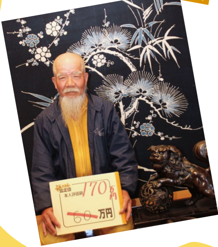
あき北支所管内より