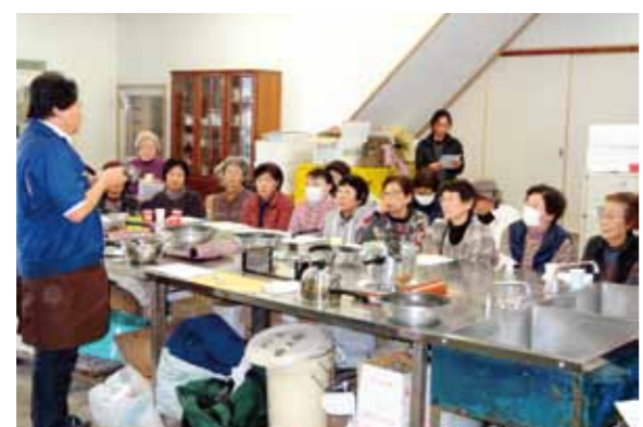
ムスイ鍋を使った料理の作り方を学ぶ部員

女性部大方支所は毎月様々な活動を行っています。今年度はもの作りを楽しむ「ふれあい教室」の開催回数を増やしました。部員に好評で、毎回40人前後の参加があります。今年度3回目となる1月28日には、38人が大方支所改善センターで防災プレズレットを作り、ムスイ鍋を使った料理の作り方を学びました。 1回目はEM石鹸作り、2回目は牛乳パックを使った椅子作りを楽しみました。4回目は桃の節句を前に2月13日、紙粘土で雛人形を作る予定です。