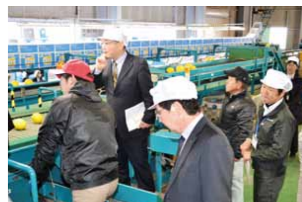
文旦光センサー選果機を視察する市場関係者ら

県産の農産物の優位販売に取り組む中部土佐会のメンバーが1月28、29の両日、産地の状況や出荷動向などを確認するため、幡多地区管内を視察しました。佐賀支所のニラそぐり機と大方支所のキュウリ選果機、宿毛支所の文旦光センサー選果機が稼働する様子を見学しながら、JA職員から各選果機の機能などを聞きました。 視察したのは長野県と岐阜県の市場関係者です。佐賀、宿毛の両支所管内では、ほ場で生産者との情報交換も行いました。