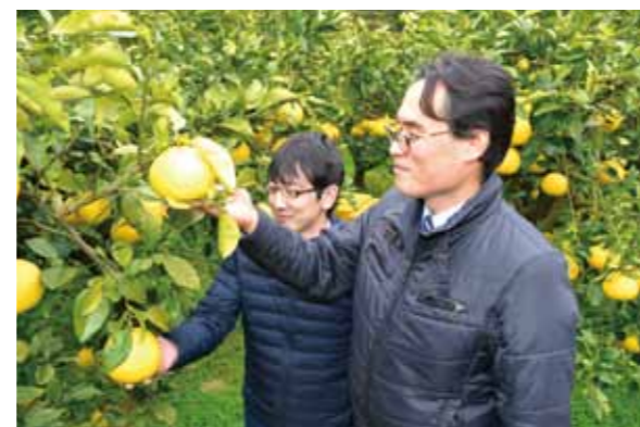
宿毛市の園地で土佐文旦の品質を確かめる参加者

県内スーパーのサニーマートは1月10日、土佐文旦の店頭販売を前に、宿毛市の園地を視察しました。生産者から今年の出来や生産への思いなどを学び、販売に力を入れることを確認。同月18日から県内外の24店舗で同市産の販売を始めました。土佐市産は2月中旬から販売予定です。 視察したのは同社のバイヤーとリーダーの約30人。新人リーダーは「アピールポイントが分かったので販売意欲が強まった」と、手応えを感じていました。