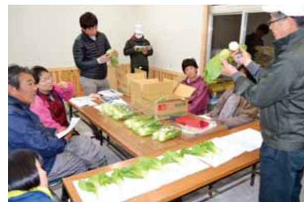
チンゲンサイの出荷基準を再確認する部員

大正支所園芸部チンゲンサイ部会は1月28日、同支所に完成間近の会議室でチンゲンサイの目慣らし会を開きました。3月の出荷最盛期を前に、出荷基準と異物混入の防止を再確認しました。同支所の平成30年の出荷量は約8tでした。 新しい会議室は5〜6坪の面積で、20人程度までの会議に使うことができます。2月中旬に冷暖房設備を設置して完成する予定です。同支所には応接室や会議室がなかったため、旧精米所跡地を会議室に改修しました。