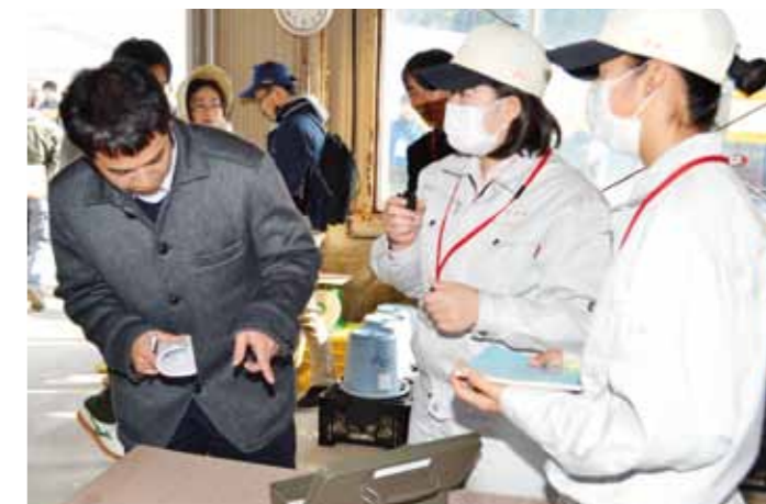
審査員の質問に答える幡多農高の生徒