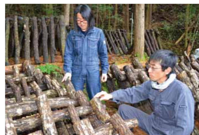
シイタケ振興に取り組む地域おこし協力隊

県立幡多農業高校は1月16日、同校で日本版農業生産工程管理（JGAP）認証の公開審査に挑戦しました。園芸システム科が栽培するミニトマトでの認証取得を目指します。県内の高校で同認証の審査が行われるのは初めて。JGAPは、食の安全や環境保全に取り組み農場に与えられる認証制度で、農場での仕事を効率化し、経営改善や品質向上、技術の継承などに役立てることができ 観点から改善に取り組んできた同科3年生7人が中心となり、書類審査と現地審査に臨みました。現地審査では、審査員にミニトマトの栽培管理やハウス内の衛生管理などを説明。審査員はハウスや収穫物調整室、農薬保管室などを視察し、120にわたる審査項目を1つずつ確認しました。 審査の結果は2月中旬に確定します。同校は審査の約2週間後に改善点の通知を受け、改善策を報告した後に認証を受ける予定。公開審査には県の職員やJA高知県幡多地区の職員も参加しました。